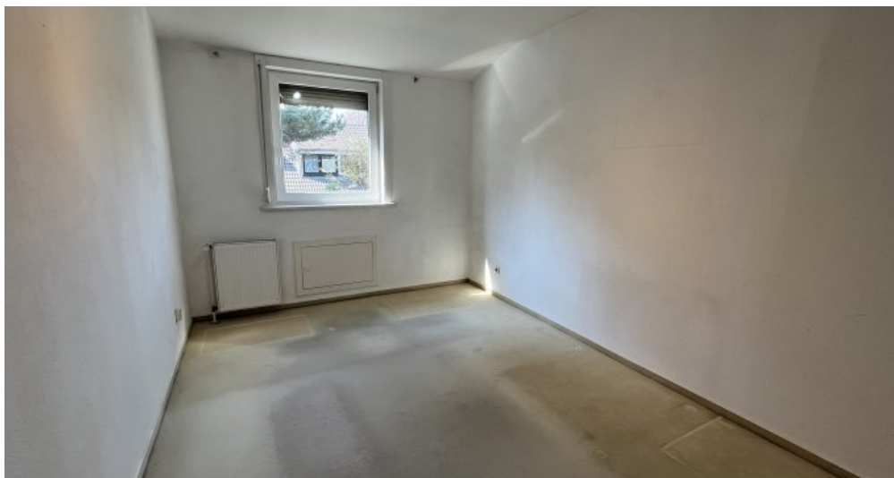
Oben keine Schrägen