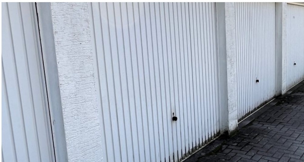
Und die Garage