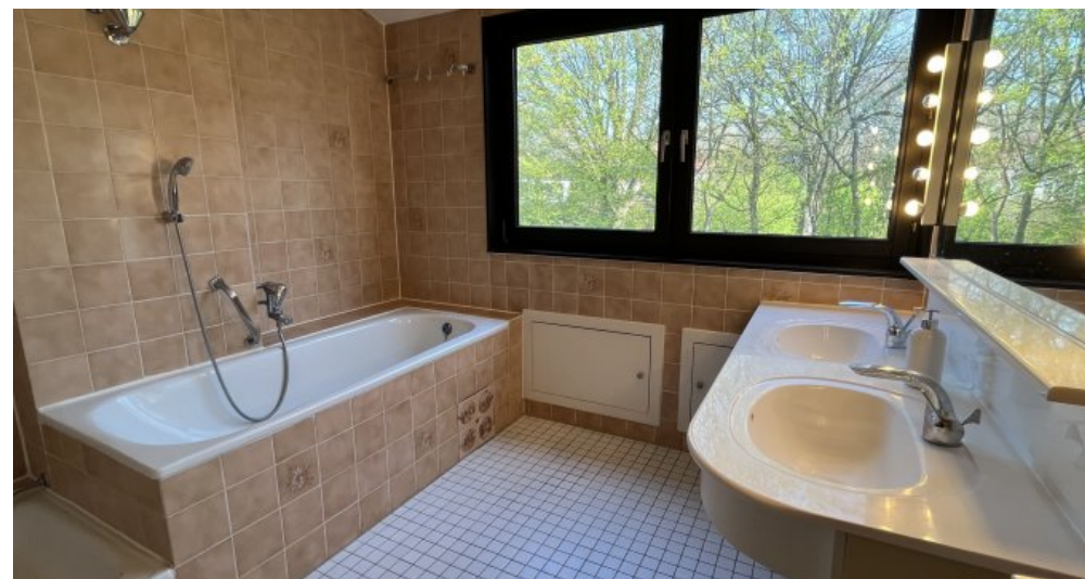
Bad mit Fenster