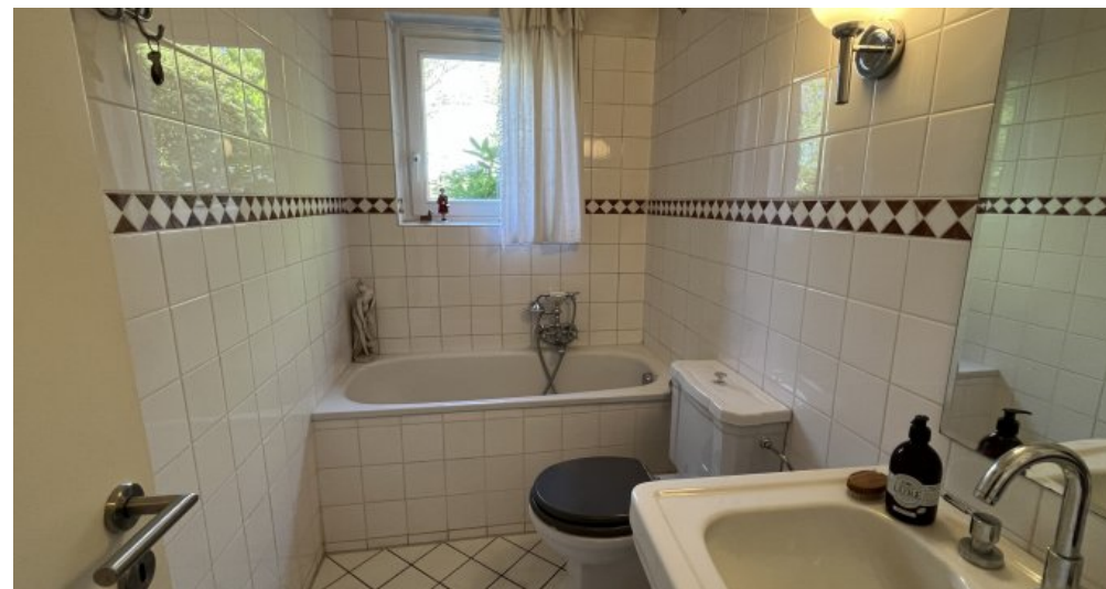
Vollbad im Erdgeschoss