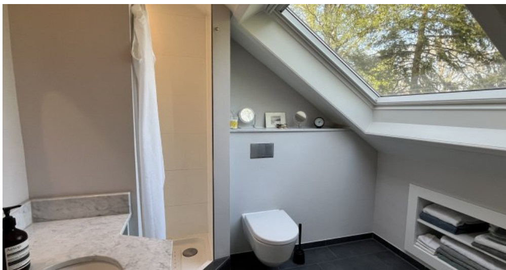
Duschbad mit Aussicht