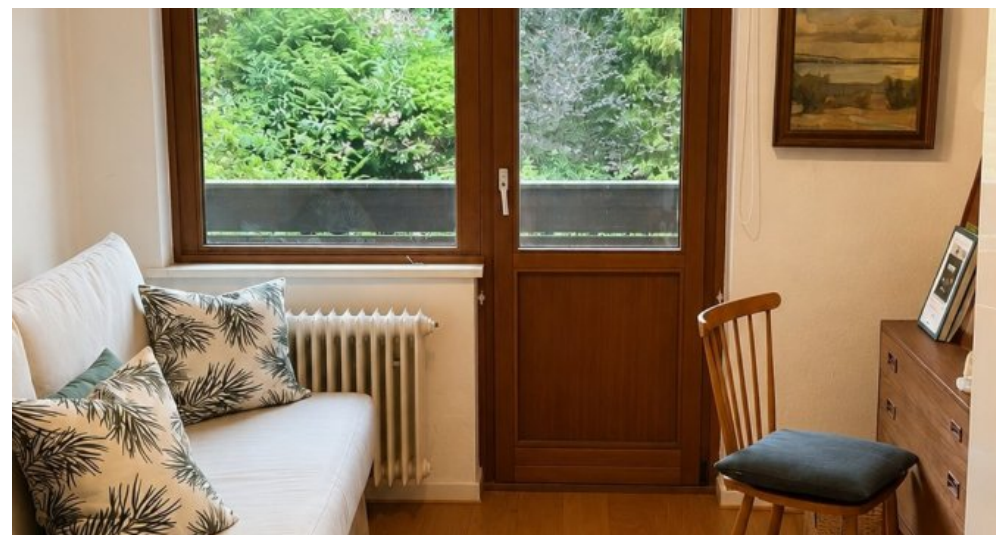
mit Zugang zum Balkon