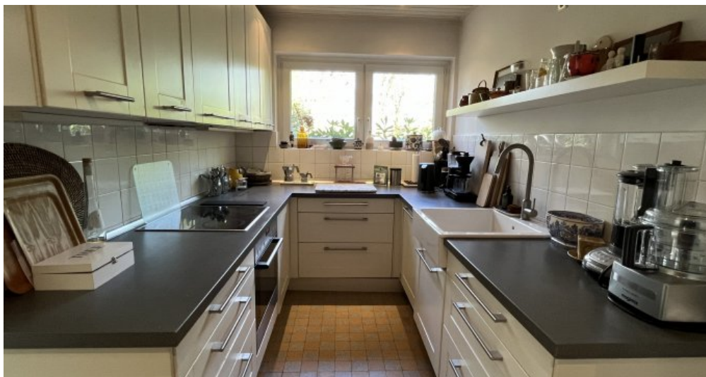
Gut möblierbare Küche