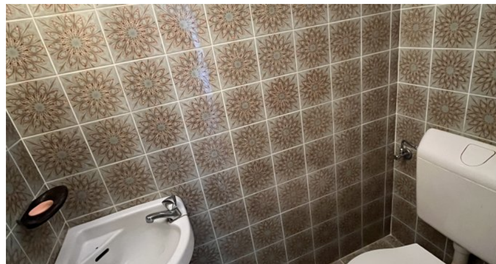
Und ein Gäste-WC