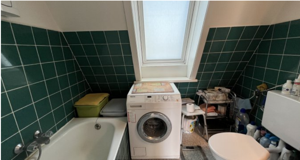
Vollbad mit Fenster